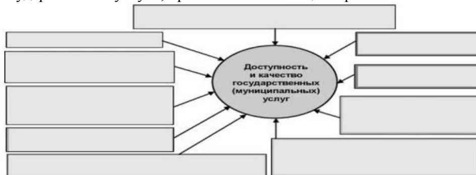
Ключ к выполнению задания

1. На основании открытых данных (порталов органов власти) составить схему «Доступность и качество государственных (муниципальных) услуг». Указание: выбрать описание государственной услуги, провести схематизацию требований к качеству.